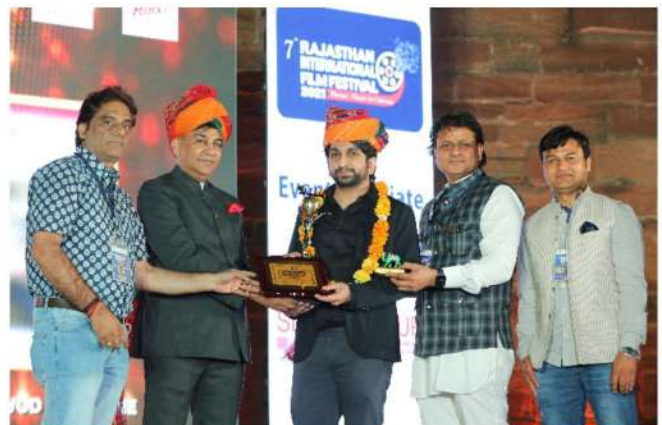
RIFF 2021 - OLDEST & FIRST HINDI BOLLYWOOD MAGAZINE: MAYAPURI