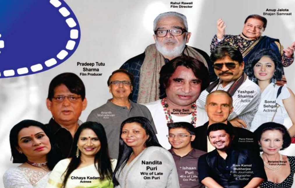
Rahul Rawail Film Director