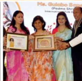
Women Achievers Award 2019