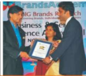
Business & Service Excellence Award - 2012