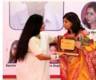
"Constant Contributor Award " by L.M. Eshwar Foundation- 2018