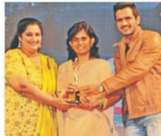
Women of The Future Awards - 2015