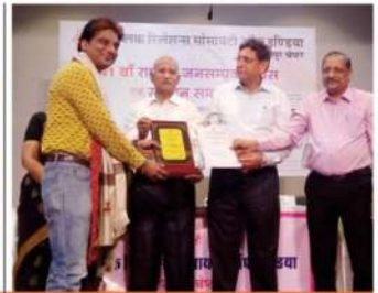
Special Recognition Award on National PR Day - 2018