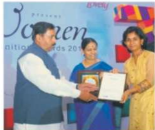
95 FM Tadka's Women Recognition Awards 2014