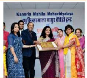
महिला शिरोमणि सम्मान 2019