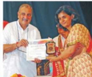
Calgiri & Canada Rajasthan Association of North India (RANA) 2014 Award