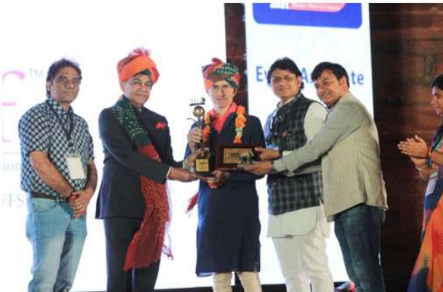
RIFF 2021 - HONORARY AWARD FOR EXCELLENCE FOR CONTRIBUTION IN INTERNATIONAL CINEMA: PIERRE FILMON (FRANCE)