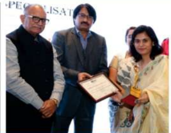
Pride of Jaipur from Bulletin Today - 2018