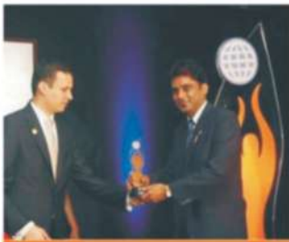
THE BIZZ 2010

We are highly appraised by our customers for the fast service that we provide to them. Its our strong goodwill that's attracting more and more people from all over the world to become the proud customer of Ash Group