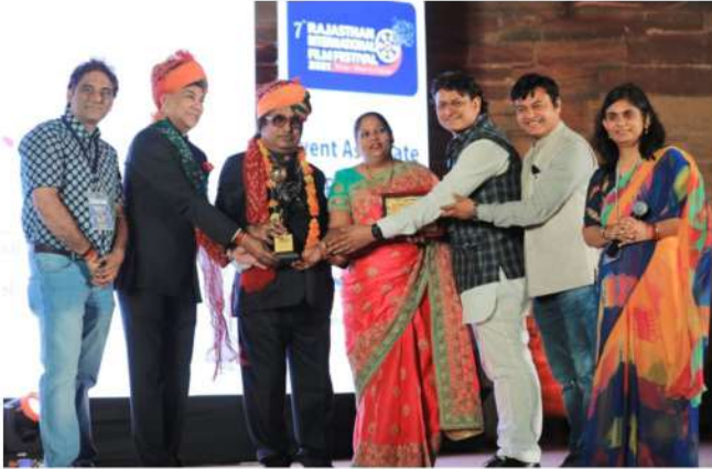
RIFF 2021 - LIFE TIME ACHIEVEMENT AWARD FOR CONTRIBUTION IN MUSIC FROM RAJASTHAN : DILIP SEN (MUSIC DIRECTOR)