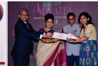
Award for Legendary - Media and Entertainment- 2018