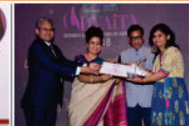
Award for Legendary - Media and Entertainment- 2018