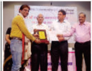
Special Recognition Award on National PR Day - 2018