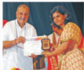
Calgiri & Canada Rajasthan Association of North India (RANA) 2014 Award