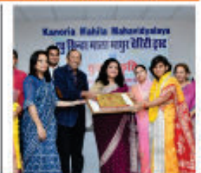
महिला शिरोमणि सम्मान 2019