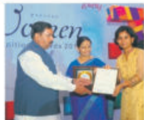
95 FM Tadka's Women Recognition Awards 2014