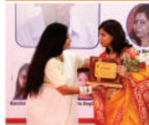
"Constant Contributor Award " by L.M. Eshwar Foundation- 2018