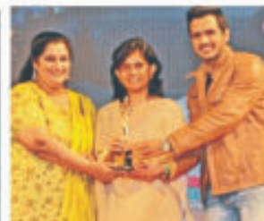
Women of The Future Awards - 2015