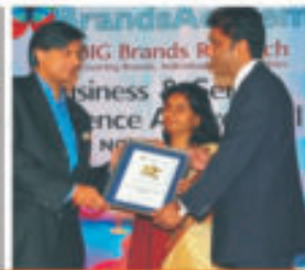
Business & Service Excellence Award - 2012