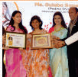
Women Achivers Award 2019