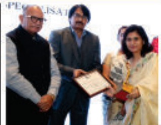
Pride of Jaipur from Bulletin Today - 2018