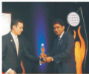
THE BIZZ 2010

We are highly appraised by our customers for the fast service that we provide to them. Its our strong goodwill that's attracting more and more people from all over the world to become the proud customer of Ash Group