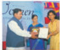
95 FM Tadka's Women Recognition Awards 2014