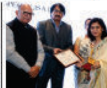
Pride of Jaipur