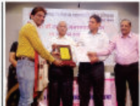
Special Recognition Award on National PR Day - 2018