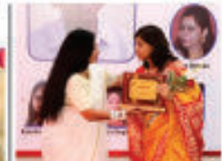
"Constant Contributor Award" by L.M. Exhaur Foundation