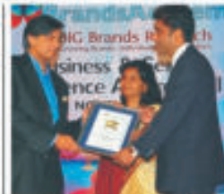
Business & Service Excellence Award - 2012