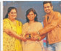
Women of The Future Awards - 2015