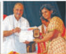
Calgiri & Canada Rajasthan Association of North India (RANA) 2014 Award