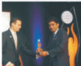
THE BIZZ 2010

We are highly appraised by our customers for the fast service that we provide to them. Its our strong goodwill that's attracting more and more people from all over the world to become the proud customer of Ash Group